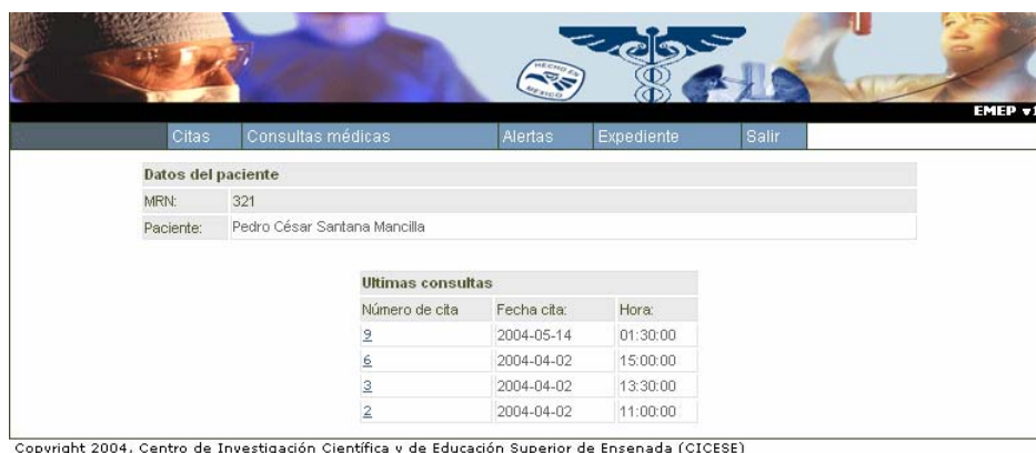
Fig. 2- Cliente Tablet PC .

Mientras el médico de turno realiza sus rondas de rutina en los cuartos de los pacientes, llega a la cama 12 y desea verificar la evolución del paciente, entonces haciendo uso de un dispositivo manual ( Tablet PC ) con conexión inalámbrica ingresa al cliente Web (Figura 2) del expediente electrónico e introduce el identificador del paciente, inmediatamente obtiene en su pantalla la información del paciente, donde puede revisar sus síntomas, verificar su evolución e incluso realizar nuevas anotaciones al expediente.